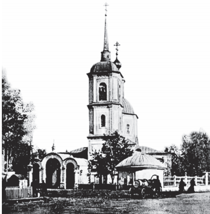
Спасский собор Каинска. Открытка конца XIX века