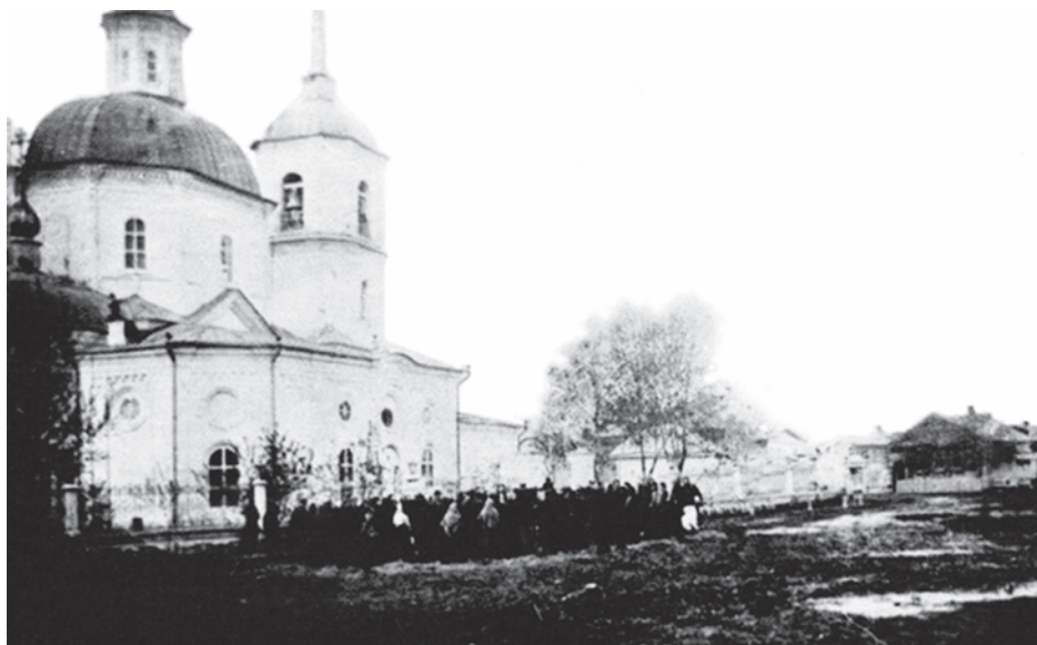
Спасский собор Каинска. Фото начала XX века.