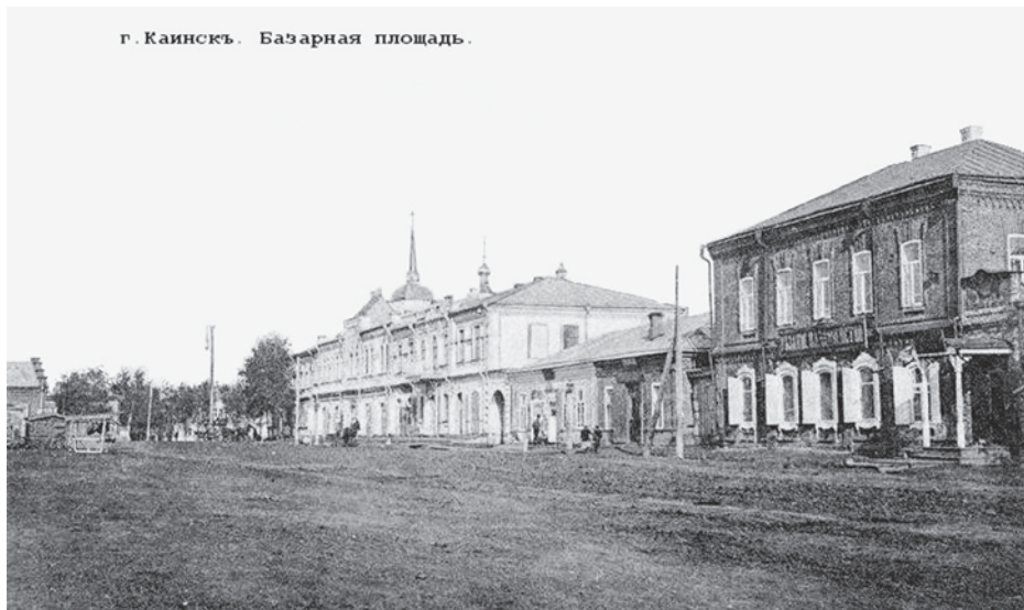
Каинск. Базарная площадь. Открытка. 1903 год