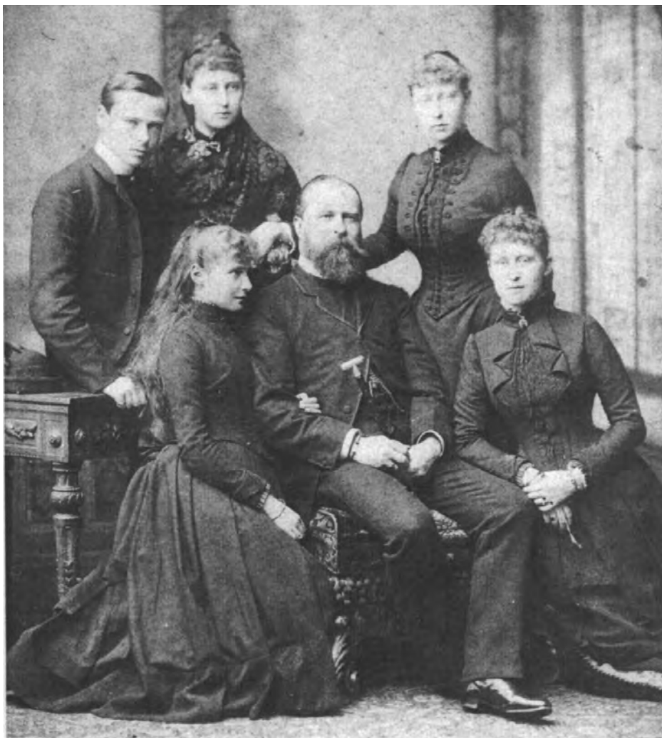
Великий герцог Людвиг IV со своими детьми. Дармштадт. 1884 г.