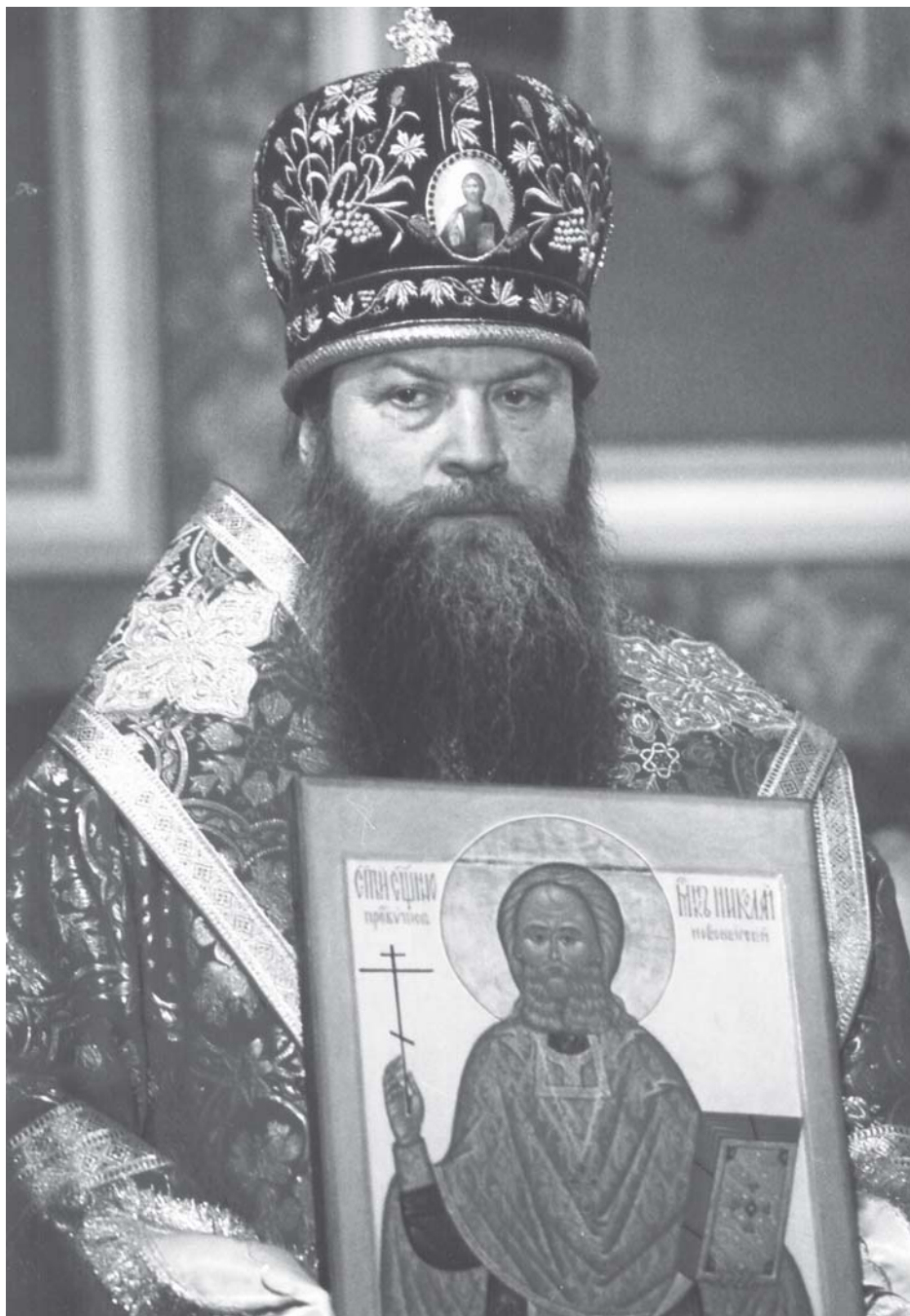
Архиепископ Новосибирский и Бердский Тихон с иконой священномученика Николая, пресвитера новосибирского, в день прославления святого 23 мая 2002 г.