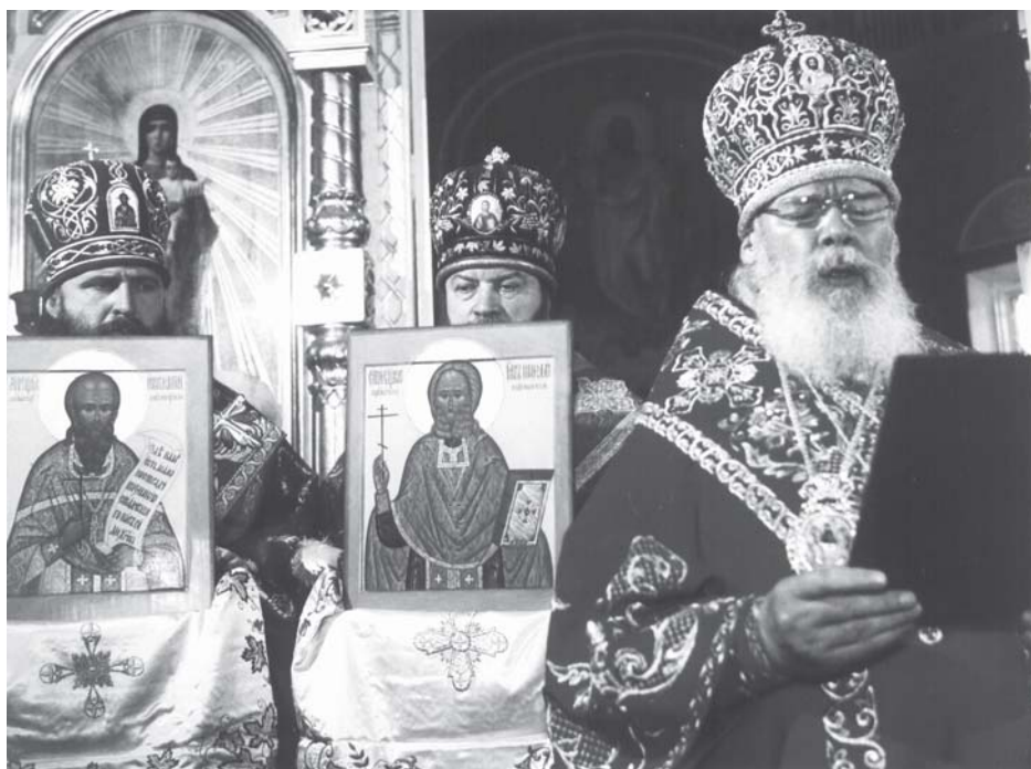
Прославление священномучеников Иннокентия и Николая, пресвитеров новосибирских. Вознесенский кафедральный собор, г. Новосибирск, 23 мая 2002 г.

Кикина к лику священномучеников для общецерковного почитания и включения их имен в Собор новомучеников и исповедников Российских XX века.